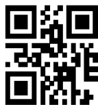
Contoh QR code

Ditetapkan di pada tanggal An. BUPATI/WALIKOTA/KEPALA PTSP KABUPATEN/KOTA ..... KEPALA LEMBAGA PENGELOLA DAN PENYELENGGARA OSS